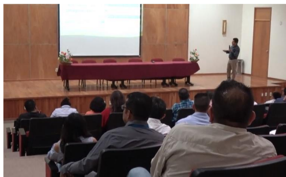
Imágenes. Participación en el curso del Distintivo 2019

La siguiente etapa de la Convocatoria consistió en que las dependencias, entidades y unidades de apoyo registradas tuvieron un plazo de 15 días naturales contados a partir de la capacitación para integrar su Plan Operativo de Ahorro y Eficiencia de Energía Eléctrica en el portal http://energia.guanajuato.gob.mx/distintivo/ contenido por lo siguiente: